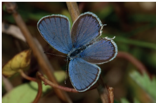
Südlicher Kurzschwänziger Bläuling